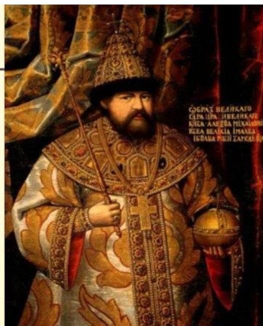
Алексей Михайлович Романов, 19 (29).03.1619- 29.01 (08.02) 1676.

Во времена царя Алексея Михайловича Романова услышать на улице мат было просто невозможно. И это объясняется не только скромностью наших предков, но и политикой, проводимой государством. По Соборному закону за использование непотребных слов применялось жестокое наказание – вплоть до смертной казни.